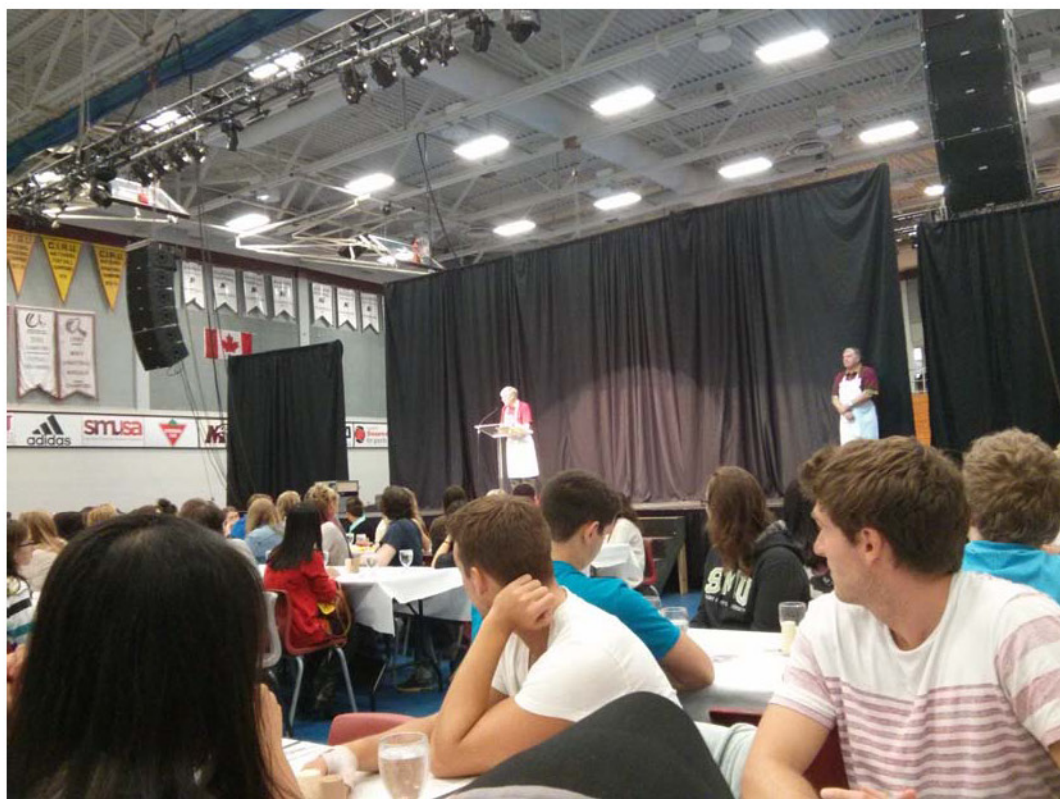
（海大学子在加拿大圣玛丽大学参加丰富的课外活动）

一定要有一次远行，要到一个没有人认识你的地方去。这样，蔽去了身边所有人对你的评价和赞誉，你才能安静下来，发现一个真实的，从没遇到过的自己。”，那一刻我坚定了要出国交换的信念，决心踏上这个寻求知识同时也发现自己的旅程。现在，我站在这里，我想说，我做到了，在交换的这 8 个月，每一份特殊的经历都像镜子一样帮助我看清了自己。