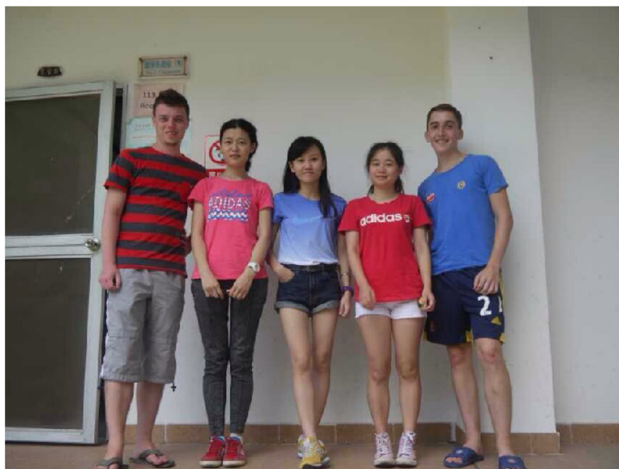
两位英国留学生和他们的海大同学

这是一种奇妙的缘分。受益于海南大学与英国纽卡斯尔大学的合作交流，原本素不相识的一批大学生，切换了彼此的生活空间和生活方式。在全方位体验对方国度的教育方式和文化特色时，又产生了哪些精彩的碰撞呢？