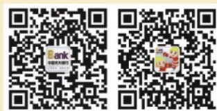
扫一扫，关注光大银行